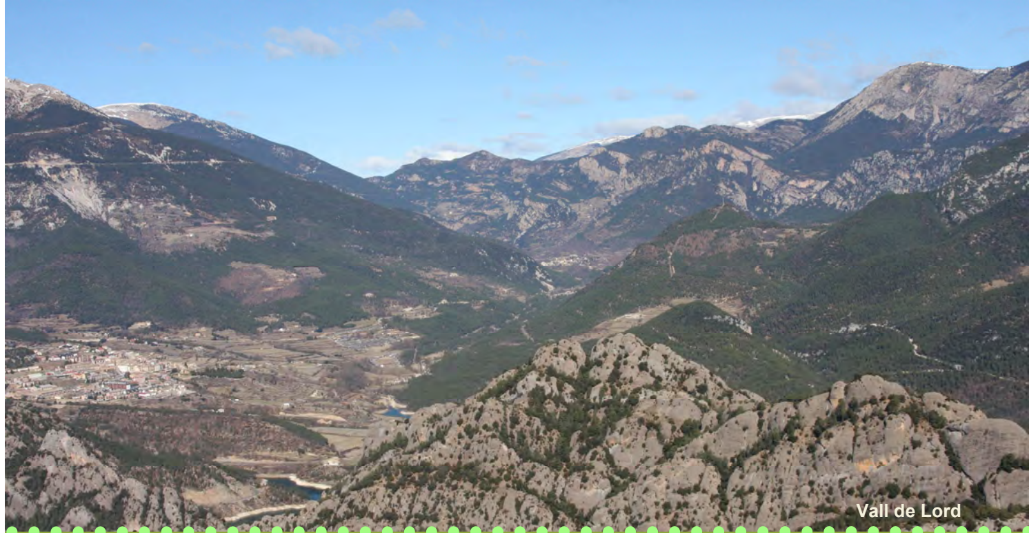
Vall de Lord